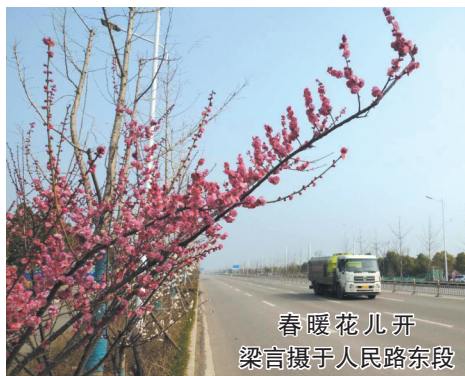
春暖花儿开 梁言摄于人民路东段