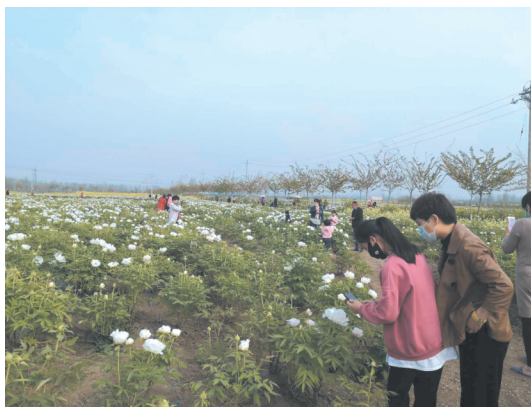
康龙农业生态园内牡丹绽放,吸引众多游客们踏青赏花

伴着春天脚步 又到了清明时节 每年的今日 都有一种深深的思念 那是对亲人的思念 更是对英雄的怀念