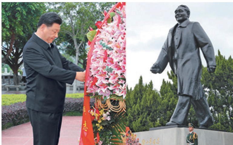
10月14日下午，习近平总书记来到深圳莲花山公园，向邓小平同志铜像敬献花篮，表达对邓小平同志的崇高敬意和深切缅怀。