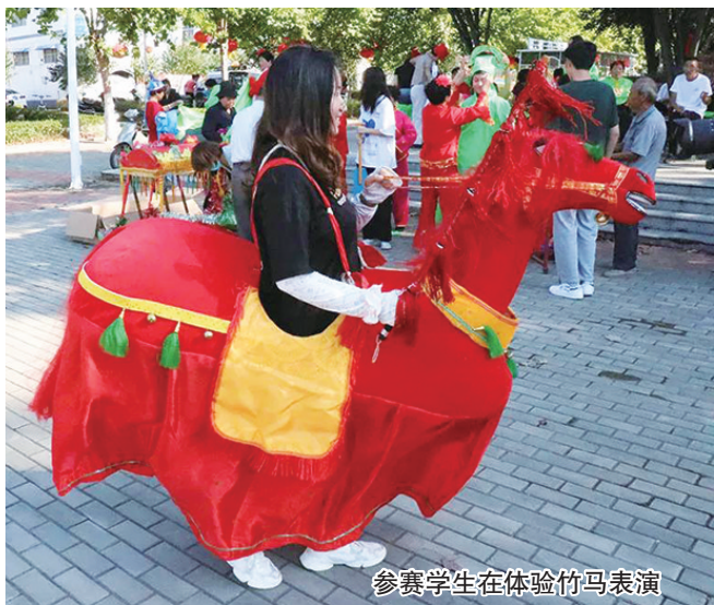
参赛学生在体验竹马表演

9月19日至9月20日,“黄河非遗点亮老家河南”首届全国大学生乡村振兴创意大赛中秋线下训练营空间类与文创类项目团队赴我县龙王沟乡村振兴示范区赛点调研。