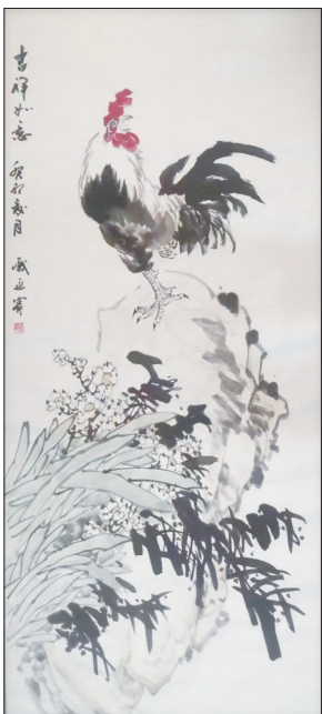
▲国画 戚延宾 作