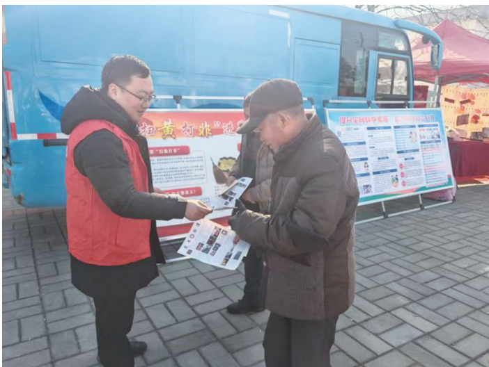
▲2月14日，张八桥镇巧妙借助姚店铺村传统的“老日子会”这一民俗活动，开展了“扫黄打非”宣传活动。

点滴“小事”更是民生“大事”。民警以实际行动践行“人民公安为人民”的初心使命，用真心真诚真情积极为群众排忧解难，值得点赞。(王露)