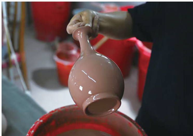
汝瓷艺人王国奇在施釉。

在宝丰，像王国奇这样的“守艺人”还有许多。“未见汝窑，不知其温润之妙。”已年逾古稀的李廷怀，是国家级非物质文化遗产代表性项目汝瓷烧制技艺代表性传承人，深耕汝瓷烧造50余年，成功复烧月白釉、卵青釉，并创新烧制玉青釉，让人得以一窥北宋风雅。