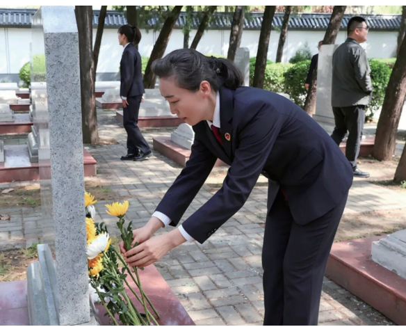
烈攻坚克难的奋斗历程,追忆峥嵘岁月,感悟初心使命。